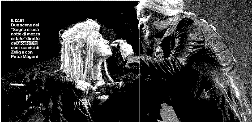
IL CAST Due scene del "Sogno di una notte di mezza estate" diretto da Ciccolini con i comici di Zelig e con Petra Magori